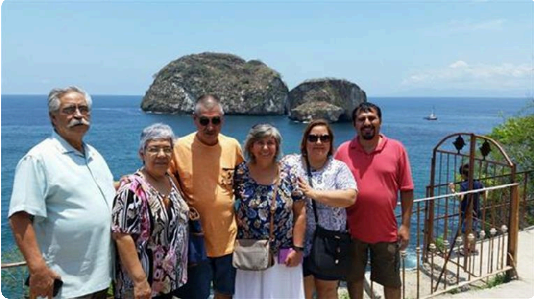
Inolvidables momentos! Siempre en nuestros corazones!